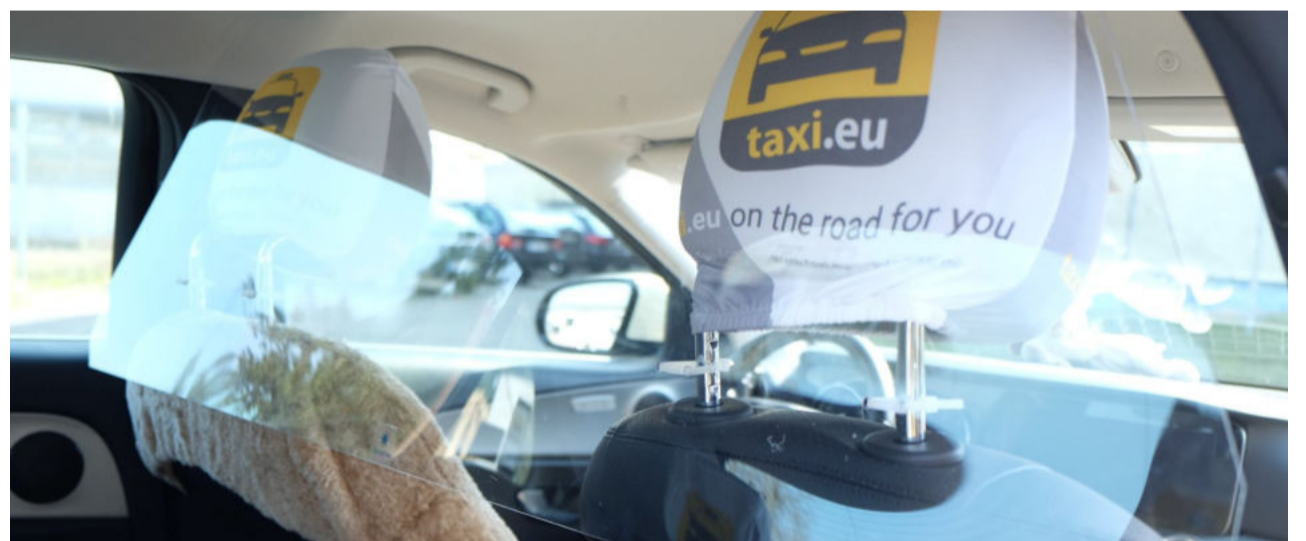
Schutzscheiben - hierdurch wird der Schutz für Fahrerinnen und Fahrer sowie Fahrgäste im Taxi erheblich erweitert.

Der Einbau des Spuckschutzes ist deshalb sinnvoll und schützt sowohl die Taxifahrer sowie deren Kunden vor Infektionen.