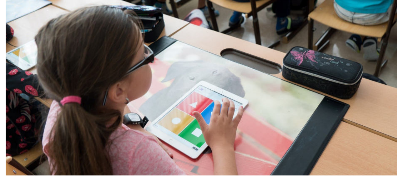
Die Krise zeigt, dass viele Schülerinnen und Schüler weder in der Schule noch Zuhause für die Schule 4.0 ausgestattet sind..

Andere Schulen verfügten bereits über etablierte digitale Kommunikationswege, und Angebote des Senats wie der Lernraum Berlin oder von privaten Anbietern von Schulsoftware zum Austausch von Lernmaterialien waren so gefragt wie noch nie. Hier zeigte sich aber