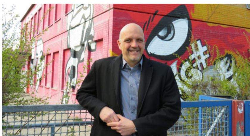
Die Jugendeinrichtungen sind geschlossen, dennoch ist das Jugendamt erreichbar.

Alle unsere Einrichtungen in Hakenfelde, Staaken, Siemensstadt und Kladow waren gut besuchte Treffpunkte an denen die Jugendlichen in Spandau sich austauschen konnten, gemeinsame Aktivitäten unternahmen oder Hilfestellungen für schwierige Lebenssituationen erhielten. In der Jugendarbeit ist der persönliche Kontakt mit den Heran-