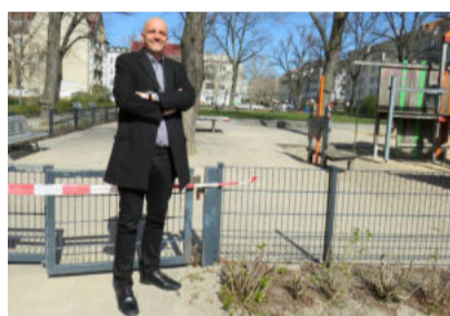
Die Spielplätze sind zurzeit zu.

ken können, aber ich muss verhindern, dass sich durch Kontakte der Virus verbreitet. Schnell mal auf kurze Distanz versehentlich genießt oder gehustet, den Virus auf andere übertragen und schon sind Risikogruppen wie Opa und Oma anderer Familien gefährdet. Gehen Sie mit ihren Kindern raus, machen Sie kurze Fahrradtouren, Waldexkursionen und Wanderungen, aber bitte vermeiden Sie nahe und direkte Kontakte mit Fremden und Gebrauchsgegenständen im öffentlichen Raum. Wir wollen alle, dass Oma und Opa auch morgen noch für ihre Enkelinnen und Enkel da sind.“